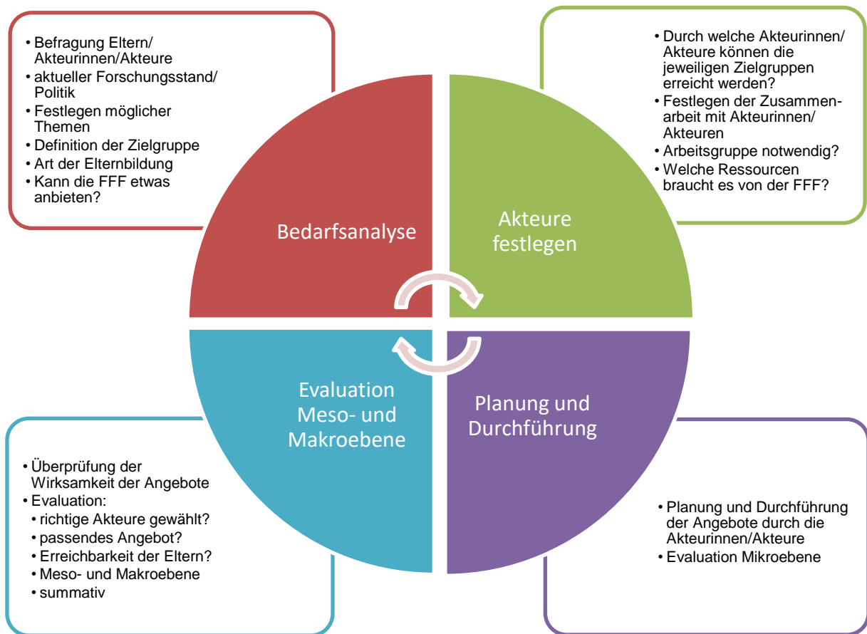
Abbildung 3: Interner Prozess der Fachstelle Frühe Förderung (FFF)