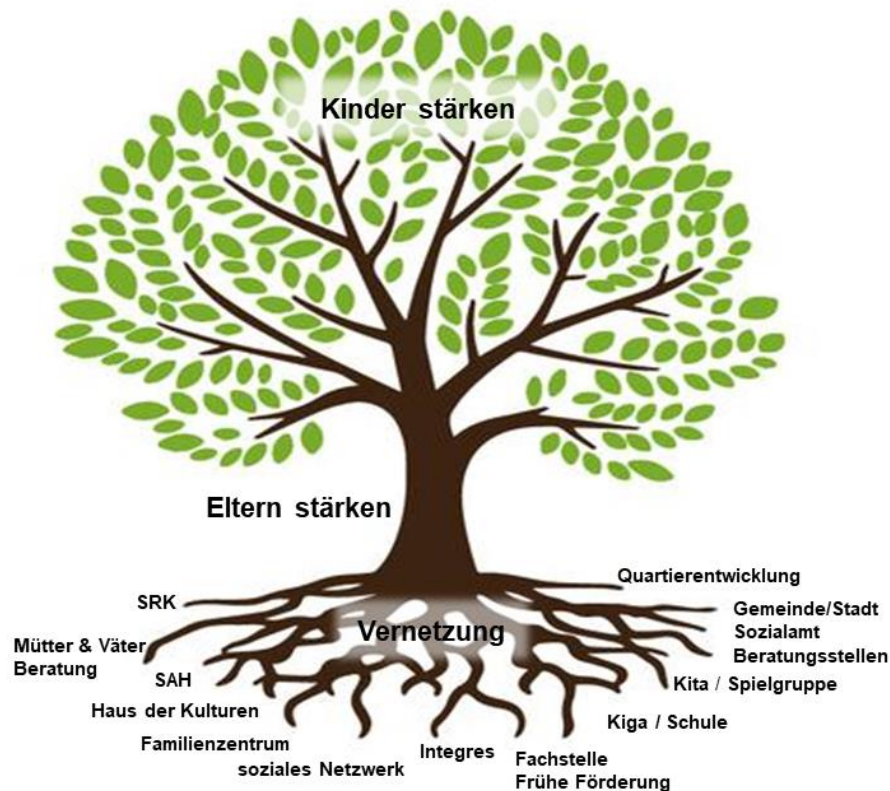
Abbildung 4: Symbolische Darstellung der Zusammenarbeit

Zum Schluss gilt es, die Erkenntnisse zusammenzuführen und in einen gemeinsamen Kontext zu setzen. In der Abbildung 4 veranschaulicht der Baum die Bedeutung der erwähnten Begriffe: