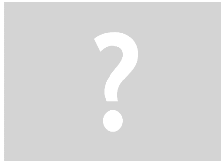
Vakanz Fachspezialistin Fachpersonen